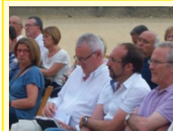
MITIN DE CAYO LARA A LLORET Clica para ver

QUE HEMOS HECHO ICV-EUIA POR LA SANIDAD EN LLORET clica para leer